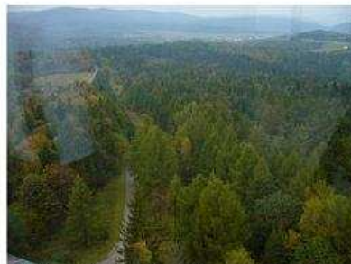
Pohľad na česko-poľské bojisko z vyhladkovej veže