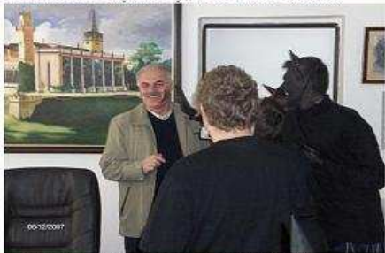
aj pán starosta. Alebo čo by k nemu prišli iba čerti?