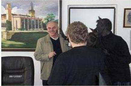
aj pán starosta. Alebo čo by k nemu prišli iba čerti?