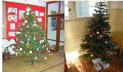
Všetade samé stromčeky, darčekov zatiaľ nie je veľa, ale

Aj naša škola sa už odela do toho najkrajšieho vianočného pláštika a my vám prinášame jeho najkrajšie kúsok