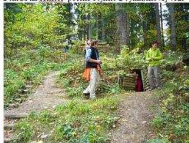
Zrekonštruované veliteľské stanovisko 3. čs. brigády