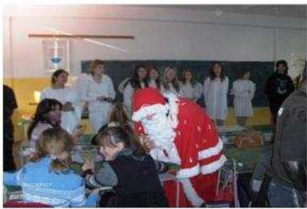
Nákulášovi sa však potešili aj „veľkí“ žiaci. A dokonca