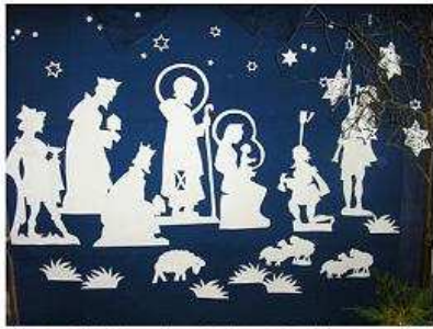
Všetci sa klaňajú malému Ježiškovi v Betleheme A takos sme počítali dni, ktorí zostávali do Vianoc