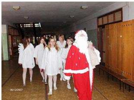
Mikuláš bol naozaj vďaka s. 24 Vianočná výzdoba školy s. 26