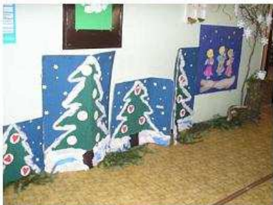
Prí vchode nás vity takýto množný čas, v ktorom už seznau rušou vládku páni zima!