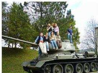
Prírodná expozícia Vojenského múzea vo Svidníku