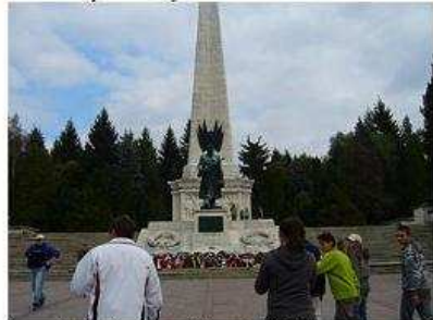
Pamätník Sovietskej armády vo Svidníku