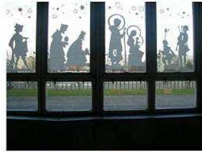
Vianoce sú už naozaj „v každom okne“