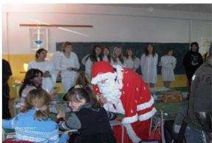
Nákulášovi sa však potešili aj „veľkí“ žiaci. A dokonca